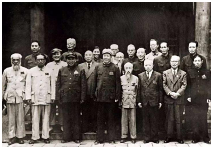
黄炎培参与筹备新政协

体现了我们党对各民主党派人士和无党派民主人士的高度尊重，让各位代表真切地感受到了新政协之新气象、新国家之新未来。同时，新政协会议也是我们党统一战线政策的伟大成果，它为即将宣告成立的新中国绘就了宏伟蓝图，奠定了中国共产党领导的多党合作和政治协商制度的基础。直到1954年9月，中国人民政治协商会议一直代行着全国人民代表大会的职权，在新中国建立初期，政治协商会议在巩固人民政权、恢复国民经济等国家建设的各领域都发挥了不可替代的作用。一直到今天，中国人民政治协商会议作为国家政治生活的重要组成部分，它向世界展示着我国协商民主的特色与新型政党制度的优势。