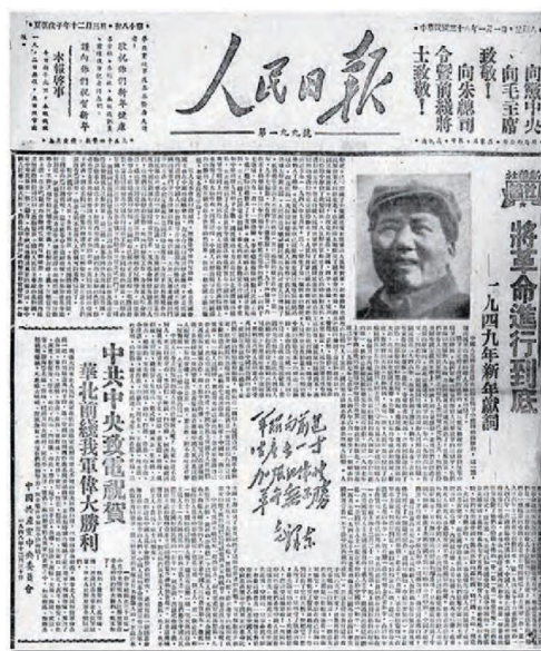
1949年元旦，《人民日报》刊发《将革命进行到底》

渡江战役是毛泽东发出“将革命进行到底”号召后的重要一战，它一举突破了国民党军的长江防线，为解放军解放华东全境和向华南、西南地区进军创造了重要条件。正如“宜将剩勇追穷寇，不可沽名学霸王”中所表达的解放全中国的决心与必胜信念，中国共产党人也正是在“将革命进行到底”的精神鼓舞下，把握人类社会发展规律，在不断发展、不断改革、不断前进的精神指引下将中国革命一步步推向成功。