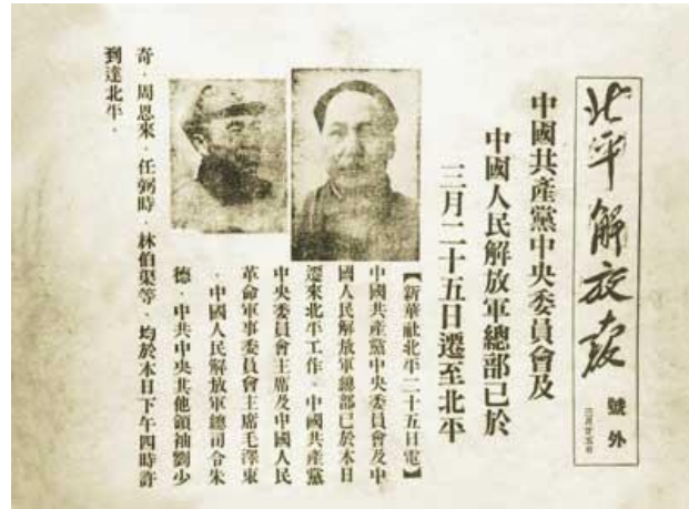
毛泽东出发去北平“进京赶考”