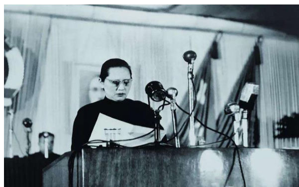
宋庆龄在新政协会议上讲话