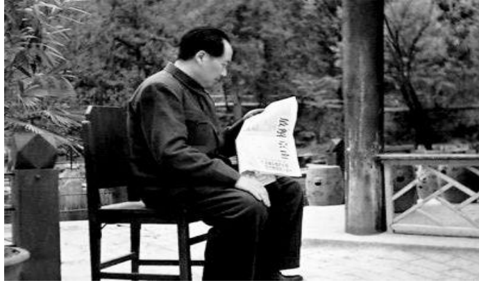
1949年4月，毛泽东在香山阅读“南京解放”号外