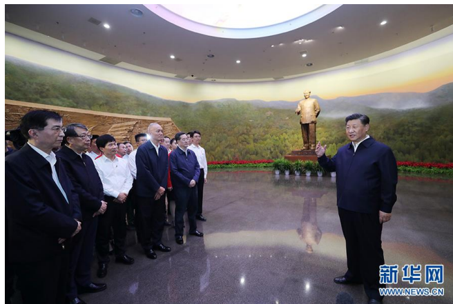
习近平视察北京香山革命纪念地